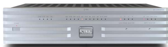
D-1N (プラチナム・シルバー)